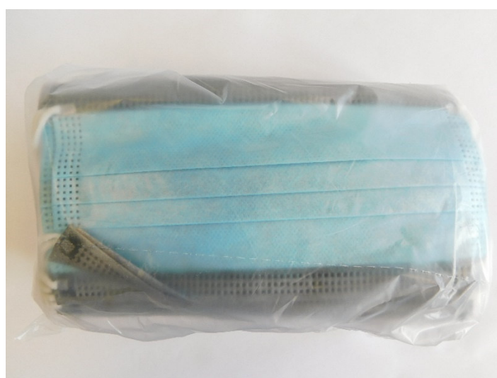
Abb. 1: Mask SQ